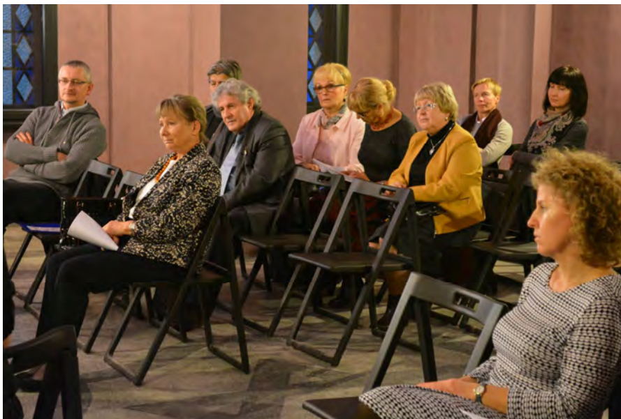
Фот. 5. Участники конференции на вечере, посвящённом Матери Марии (Скобцовой) в еврейском погребальном доме (доме очищения)-музее в Ольштыне.